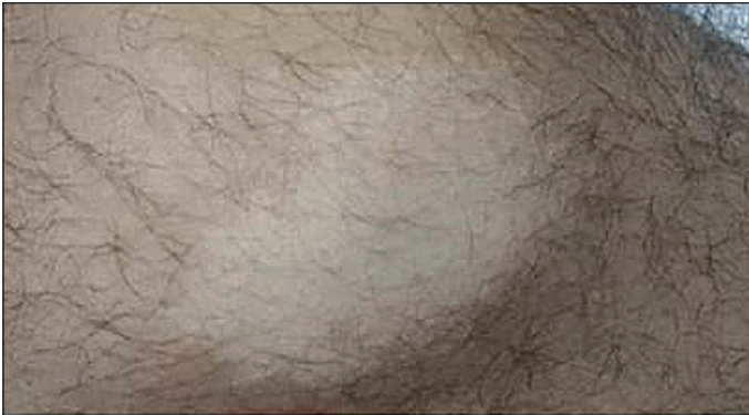
Şekil 2: Bacakta hipomelanotik makül.