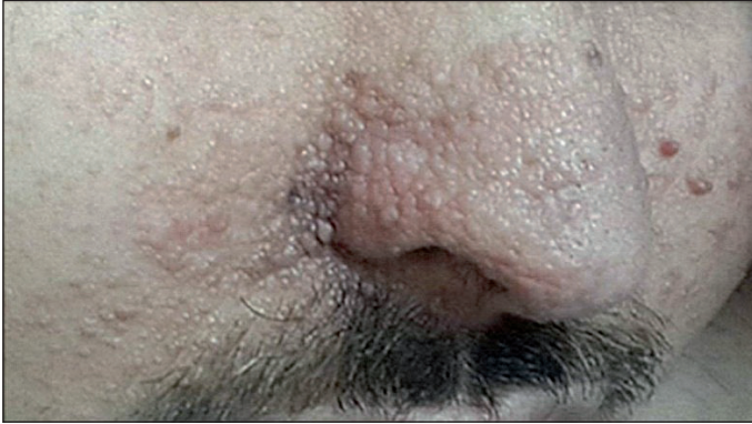
Şekil 1: Yüzde çok sayıda adenoma sebaceumla uyumlu lezyonlar.

parametreleri Tablo I'de sunulmuştur. Hematüri ve batında kitlesel oluşum nedeniyle yapılan batın ultrasonografisinde böbrek boyutları ileri derecede artmış ve polikistik görünümdeydi. Batın bilgisayarlı tomografisinde ODPBH benzer şekilde her iki böbrekte multipl, bazıları hiperdens (hemorajik içerik) kistler izlenmiş olup, her iki böbrek boyutu kistlere sekonder belirgin artmıştı (Şekil 3). Hematürinin hemorajik kistlerden veya tespit edilememiş anjiyomiyolipomlardan kaynaklandığı düşünüldü. Gerekli şekilde eritrosit süspansiyonu transfüze edildi. Mesanede hematoma geliştiği için 3-yollu sonda ile mesane irrigasyonu yapıldı. Takiplerde tekrarlayan epileptik nöbetleri olan hastanın kraniyal magnetik rezonans (MR) görüntülemesinde her iki serebral hemisferde frontoparietal bölgede daha yaygın kortikal ve subkortikal düzeyde kortikal tüberler ile uyumlu yamasal intensite artımları ve her iki lateral ventrikül düzeyinde milimetrik subependimal hamartomatöz nodüller izlendi. Hastanın antiepileptik tedavisi yeniden düzenlendi. Takiplerde kreatinin değerleri yüksek seyreden hasta kronik hemodiyaliz programına alındı.